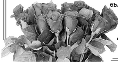
Выпуск 1992 г.

Это — особенный праздник. История школы является частью истории всего района, а за достигнутыми успехами — высокий профессионализм и пре- данность своему делу. От всей души желаем новых свершений, доброго здоровья, благополу- чия и оптимизма!